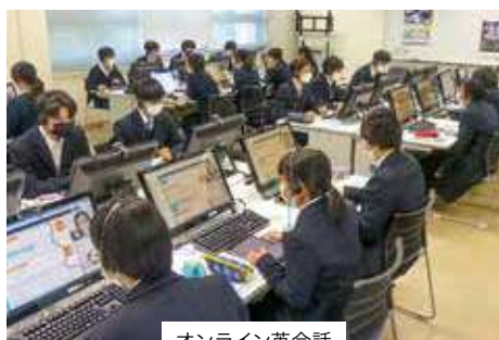
オンライン英会話

「いまひとつ理解できない、困った」「進路先を悩んでいる」など、笠岡高校では、放課後や空いた時間に、丁寧な個別相談を受けられます。学びを導く独自のガイドブック、講座・セミナー、質問スペース、自学自習スペース等を活用することで、3年間の学びが充実します。