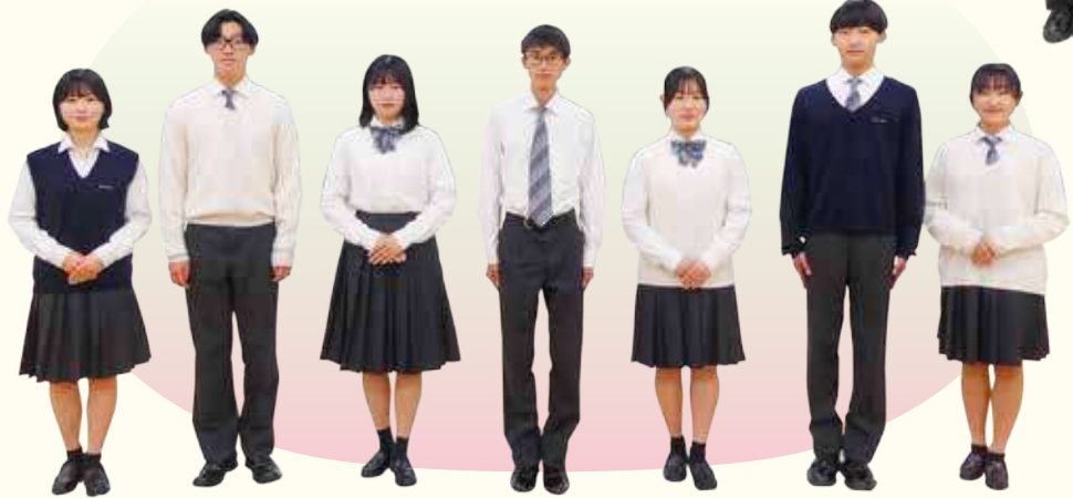
Flex Spring & Autumn