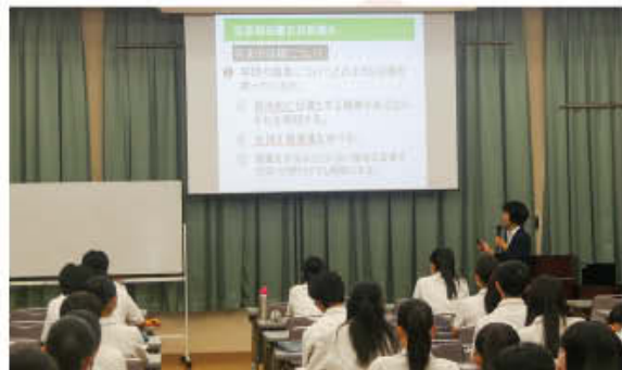
志望理由書作成講座

マンツーマンでアドバイスが受けられる小論文・面接指導システム。 志望大学の入試に対応した個別指導をしっかりと受けられます。