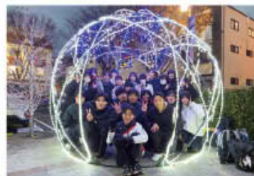
イルミネーション点灯式