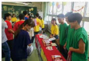
地域と繋がる物産展

笠岡高校の生徒会は、全校生徒から選ばれた役員を中心に、新入生歓迎行事をはじめ、球技大会、千鳥祭など、1年間をとおして様々な学校行事を企画・運営しています。より充実した快適な学校生活を実現するため、生徒自身の力で取り組む生徒会活動が先輩から後輩へ受け継がれています。