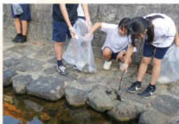
千鳥ボランティア