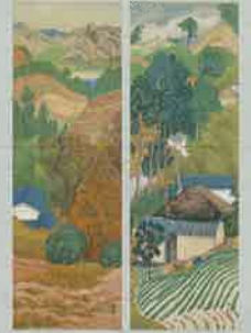
島二作（早春・冬の丘）大正5年