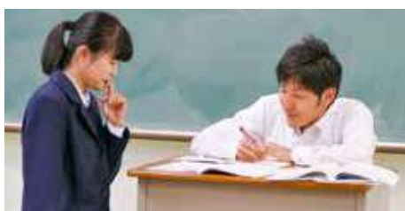
教科カウンセリング「質問教室」