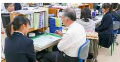
2人担任制による「生徒面談」