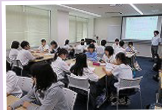
岡山大学学習合宿 8月1日～8月3日