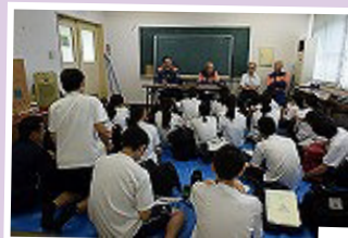
1年生ACT現地調査 7月24日