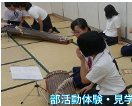
部活動体験・見学