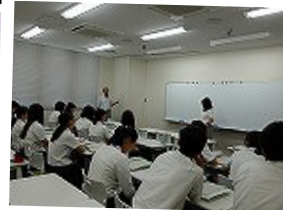
2年生ACT テーマ探究中間発表会 7月24日